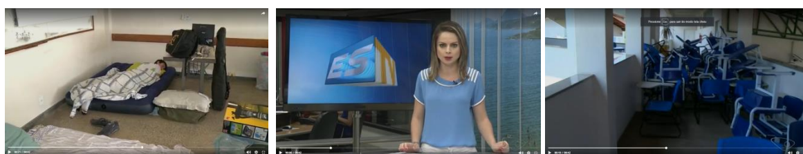
Imagens 6, 7 e 8: print da reportagem “IFES de Cachoeiro é desocupado no sul do ES”.

No mesmo dia, foi veiculada, também na TV Gazeta Sul, a reportagem “IFES de Cachoeiro é desocupado no sul do ES” 8 com quarenta e dois segundos. A expressão da mesma âncora e a estrutura da reportagem diferem bastante da notícia anterior. Sua expressão é de seriedade, sem sorrisos ou semblante leve. A reportagem se reduz a narração da âncora com exposição de imagens do instituto ocupado: cadeiras amontoadas, um jovem dormindo sob um colchão inflável num quarto aparentemente desorganizado e alunos no pátio sem desenvolverem nenhuma atividade.